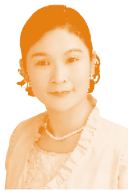
たけがみ かずみ 竹上 和見氏 (ラジオパーソナリティ) 京都府出身のアナウンサー。 コマーシャル、ナレーション、司会 などでも活躍し、主な出演番組 はKBS京都ラジオ「早川一光 のぼんざい!!人間」など。